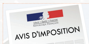
Avis d'imposition N-2

⚠ Attention lors de l'instruction de la demande des pièces supplémentaires peuvent vous être demandées selon votre situation (livret de famille, fiches de salaire etc)