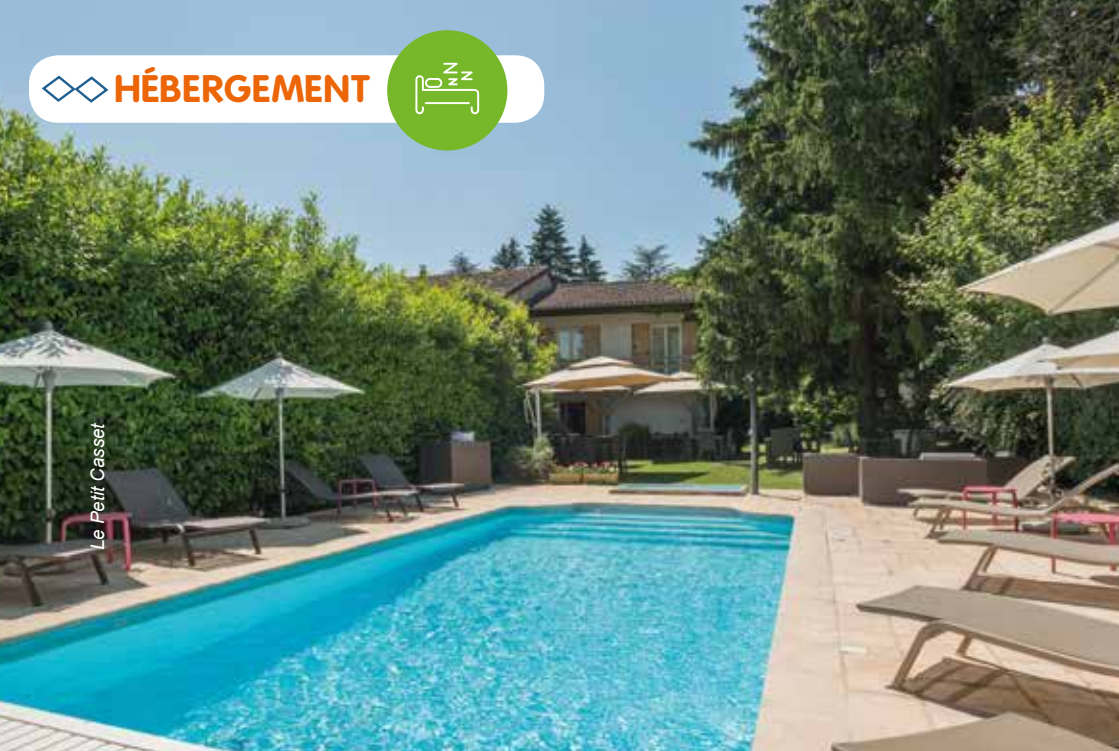
Le Petit Casset