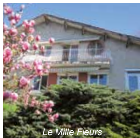
Le Mille Fleurs